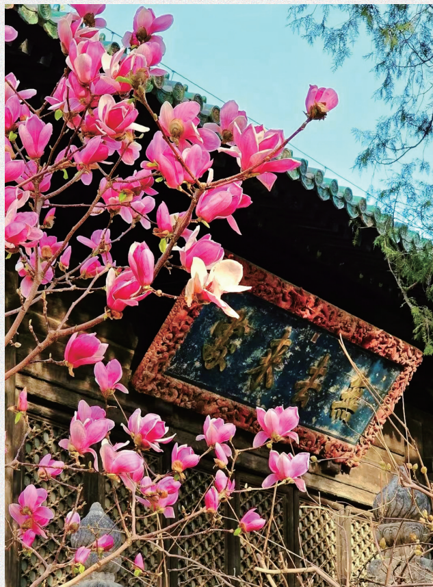
观古建闻兰香，大觉寺玉兰绽放