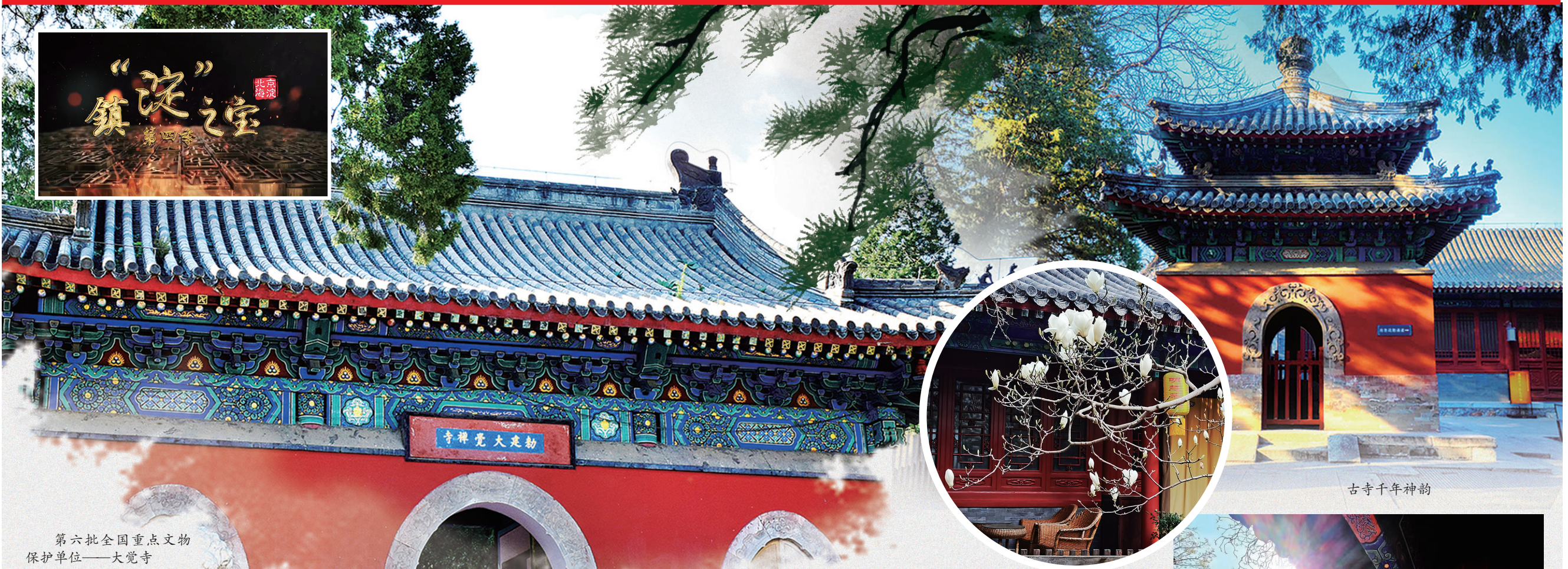
第六批全国重点文物保护单位——大觉寺