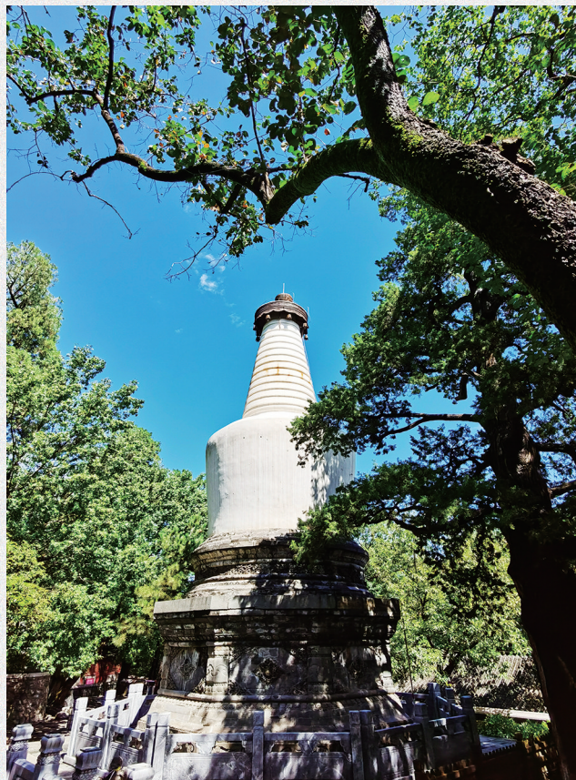
大觉寺八绝之一——白塔