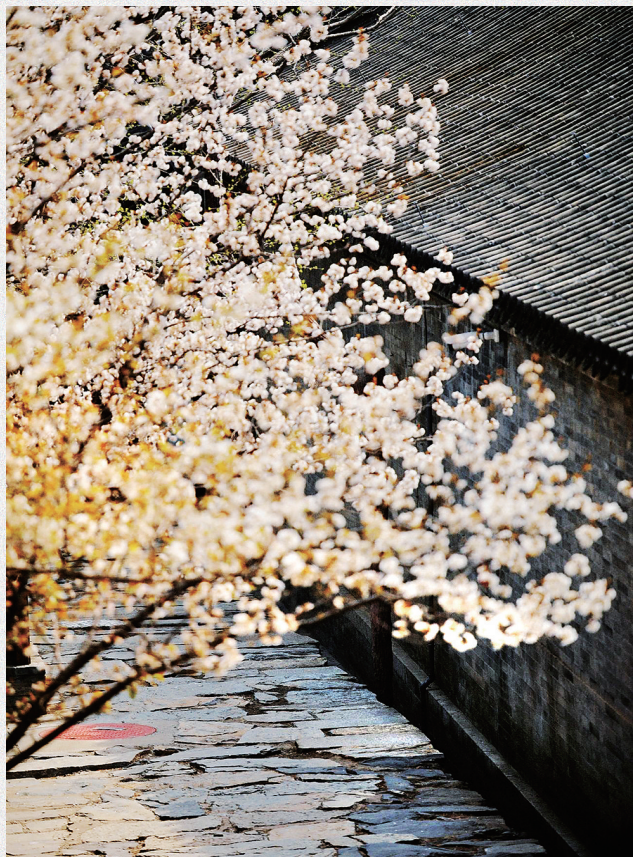
大觉寺内樱花绽放