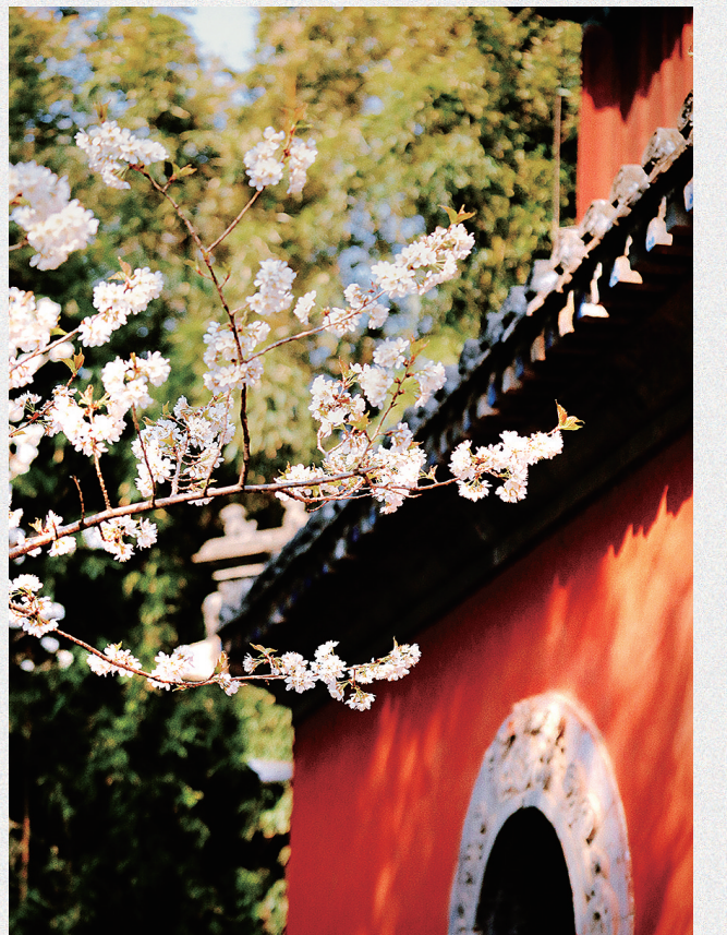
大觉寺春花烂漫