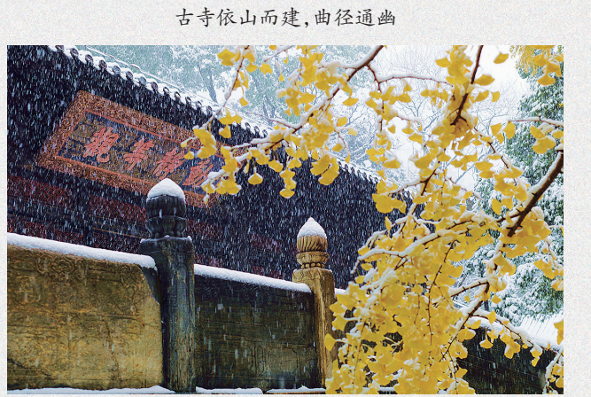
古寺依山而建，曲径通幽