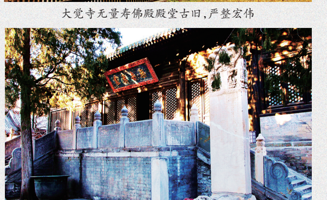
大觉寺无量寿佛殿殿堂古旧，严整宏伟