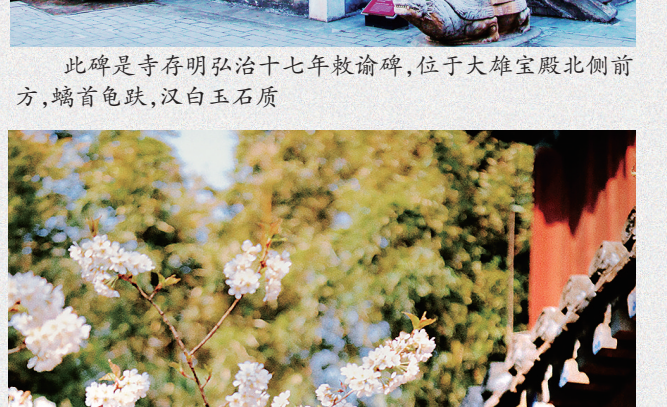
此碑是寺存明弘治十七年教谕碑，位于大雄宝殿北侧前方，螭首龟趺，汉白玉石质