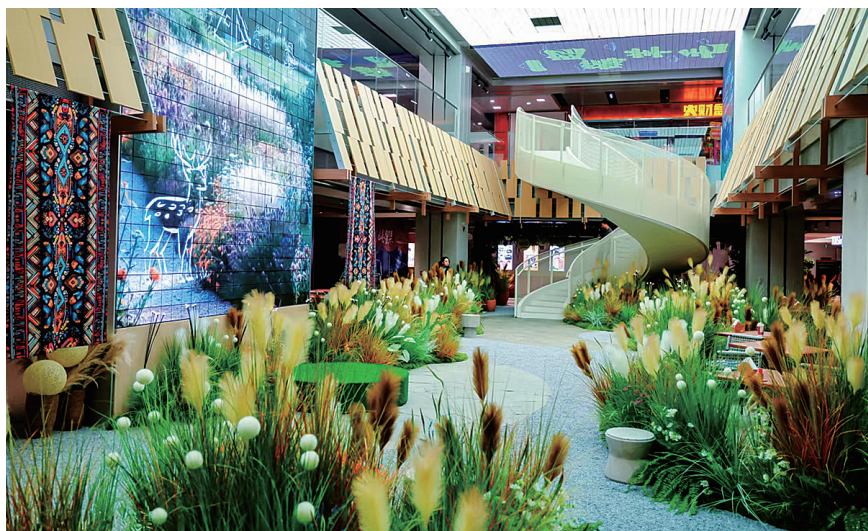
□ 本报记者 常润达

“这儿简直是把整片森林都‘搬’进了商场,氛围感直接拉满!”在1733山谷食集里,一位年轻女孩满脸兴奋地奔向同伴分享着自己的感受。日前开业的1733山谷食集凭借创新“自然生态与街店游逛”的融合模式,摇身一变成为城市中的一处神秘绿洲,引得无数市民纷至沓来,只为探寻那集美食盛宴、社交互动与自然体验于一身的全新奇妙享受。